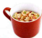
3/4杯煮熟的豆类 (豌豆、扁豆等)