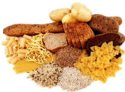
马铃薯、番薯、意大利面、粥、 原味饼干、麦片、面包、面条/米粉