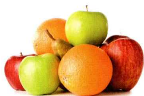
苹果、橘子、梨、木瓜、 凤梨、葡萄、龙眼、香蕉