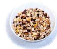
\frac{2}{3} 碗* 未煮燕麦片