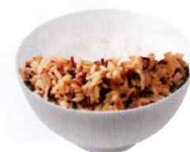
\frac{1}{2} 碗* 糙米饭